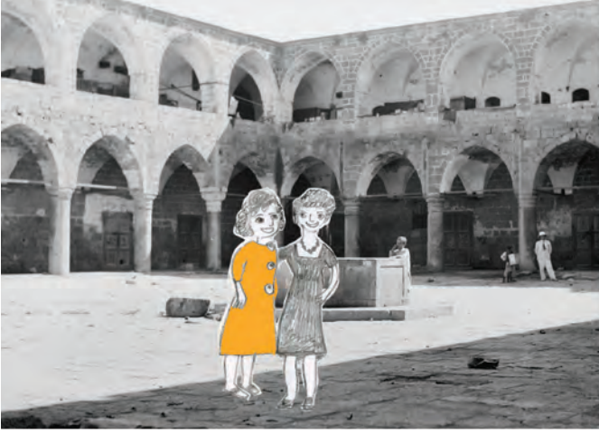
خان العمدان في عكا، بناءً أحمد باشا الجزائر في نهاية القرن الثامن عشر.

أَيُّهَا الْأَصْدِقَاءُ، لَقَدْ مَرَّ وَقْتُ طَوِيلٍ عَلَى حَدُوثِ الْقِصَصِ الَّتِي يَرُويها المَعْرُضُ، بَعْضُهَا حَدَثٌ، رَيمًا، قَبْلَ أَكْثَرِ مِنْ مِئَةِ عَامٍ، وَبَعْضُهَا الْأَخْرُ يَعُودُ إِلَى مَا هُوَ أَبْعَدُ مِنْ ذَلِكَ بِكَثِيرٍ.